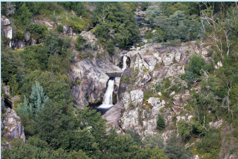
Vista desde o miradoiro